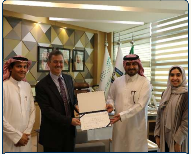
جانب من تكريم وفد المقر الرئيسي | الكويت

"أهدي هذا الإنجاز لوالدي ولجامعتي الجامعة العربية المفتوحة منارة المعرفة والعلم".