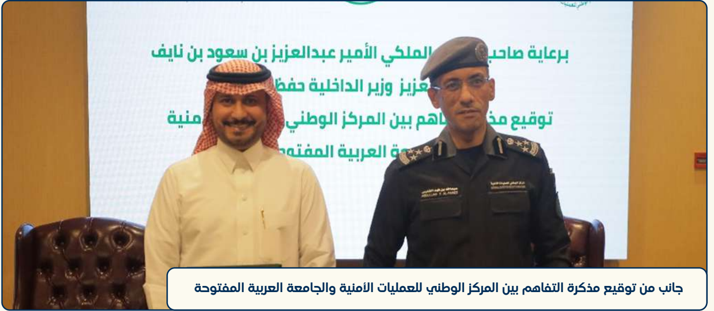
جانب من توقيع مذكرة التفاهم بين المركز الوطني للعمليات الأمنية والجامعة العربية المفتوحة