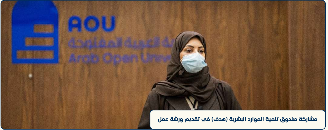
مشاركة صندوق تنمية الموارد البشرية (هدف) في تقديم ورشة عمل