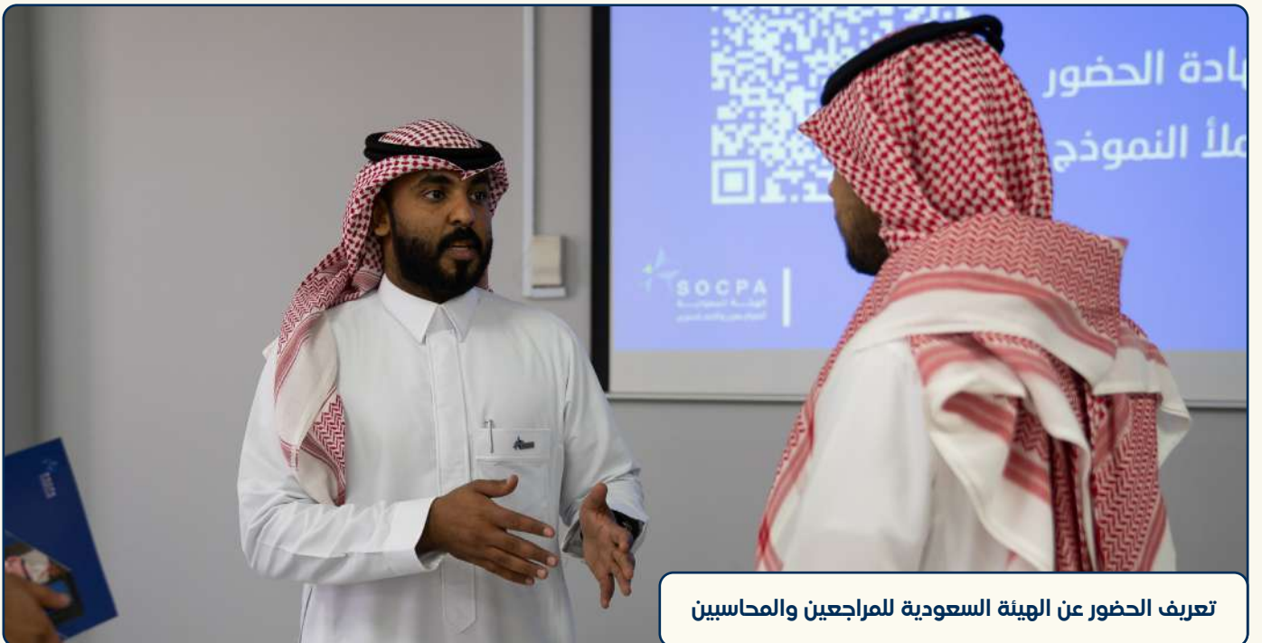
تعريف الحضور عن الهيئة السعودية للمراجعين والمحاسبين

ويأتي ذلك انطلاقًا من حرص الجامعة على تهيئة وإعداد طلبة كلية دراسات إدارة الأعمال لسوق العمل.