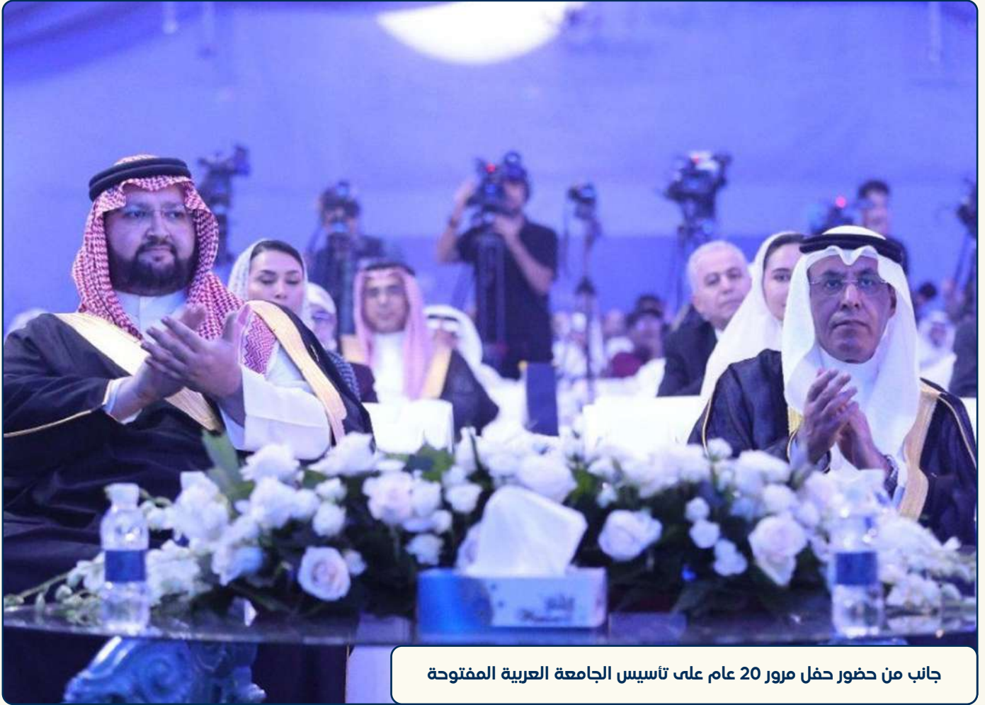
جانب من حضور حفل مرور 20 عام على تأسيس الجامعة العربية المفتوحة

الجودة العالية يجب أن يكون للجميع، ومتاكاً للإنسان الطموح مهما كانت ظروفه وأينما كان وفي أي عمر، لأن الثروة الحقيقية للأمم القوية تكمن في أبنائها وبناتها المكتسبين للمعرفة والمهارة، وكلما زاد الإنسان علماً ازدادت أمته قوة ومكانة واستقراراً وتنمية، لذا تتضمن رؤيتنا المستقبلية تركيز جهودنا على توفير المعرفة ومهارات المستقبل، لكل الشغوفين بالارتقاء أياً كانت ظروفهم ومهما ابتعدوا جغرافياً عن مراكز التعلم.