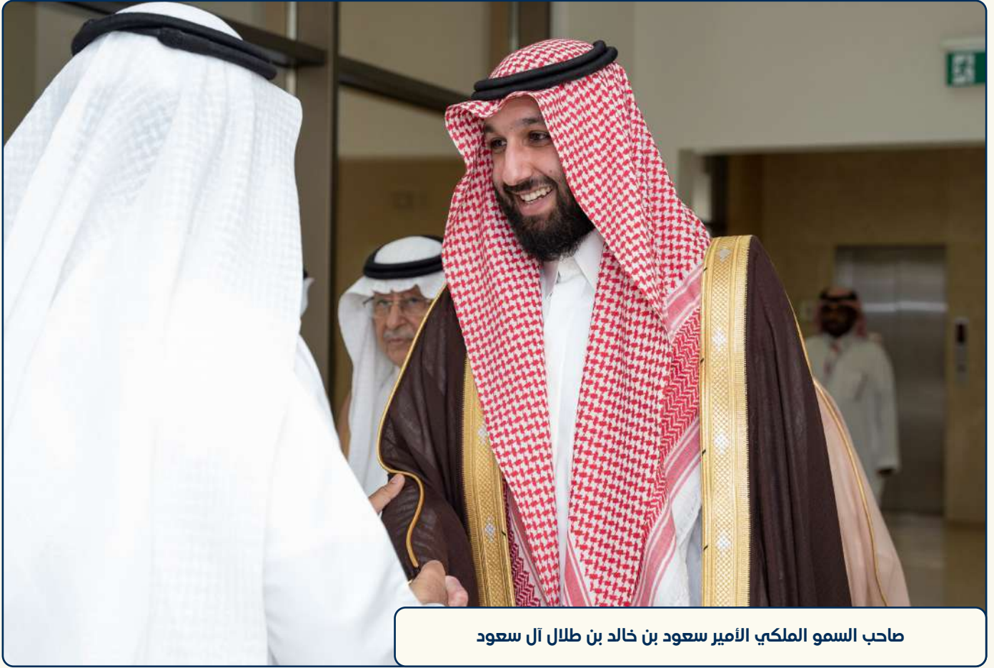
صاحب السمو الملكي الأمير سعود بن خالد بن طلال آل سعود