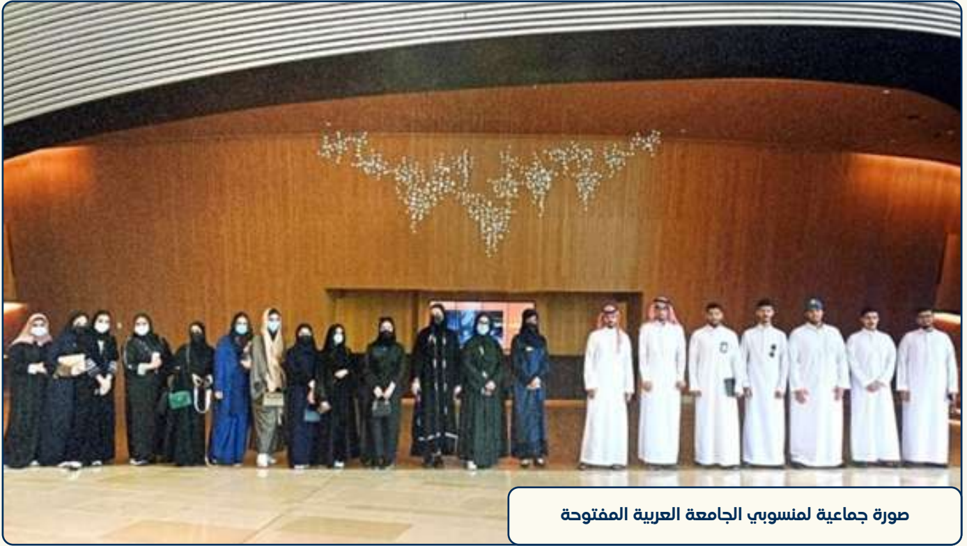
صورة جماعية لمنسوبي الجامعة العربية المفتوحة