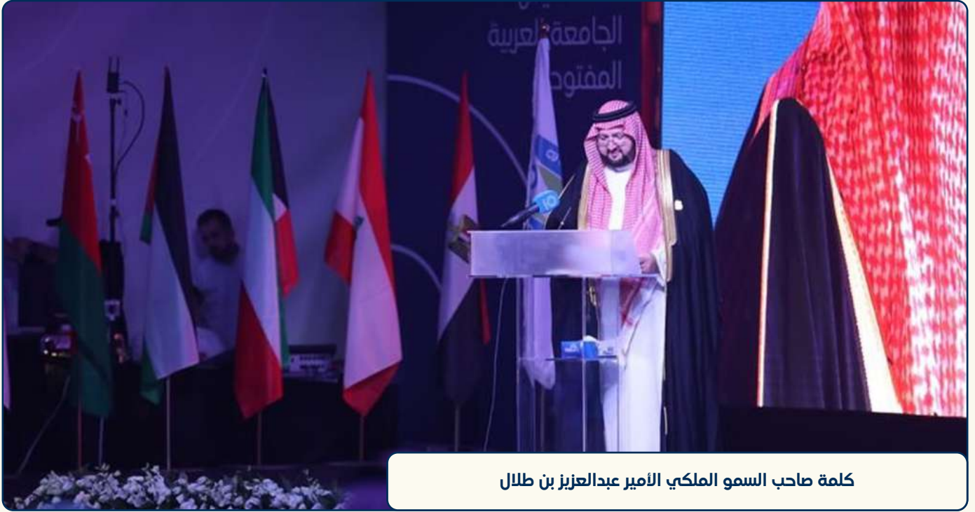
كلمة صاحب السمو الملكي الأمير عبدالعزيز بن طلال