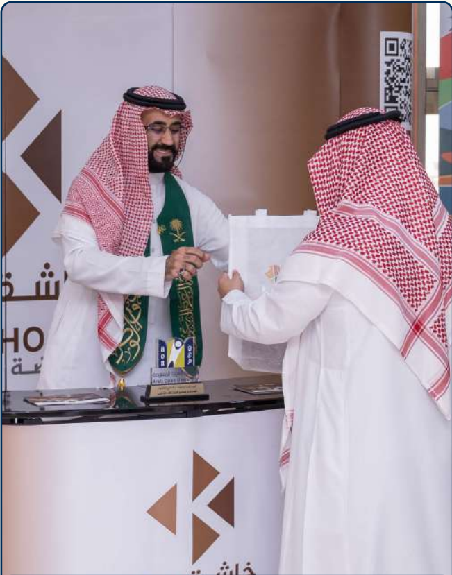
جانب من مشاركة مجموعة خاشقبي القابضة