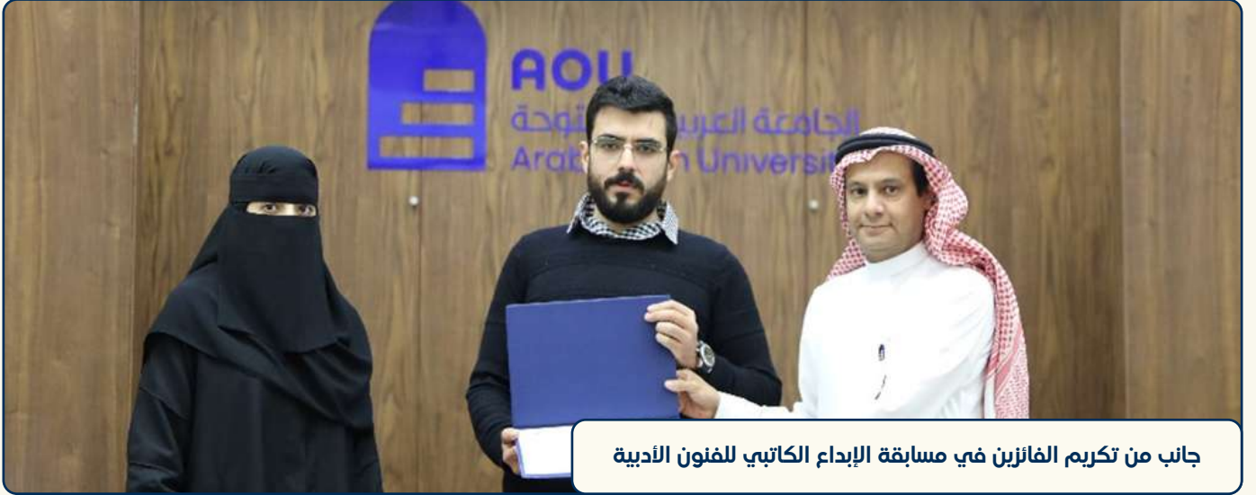
جانب من تكريم الفائزين في مسابقة الإبداع الكتابي للفنون الأدبية