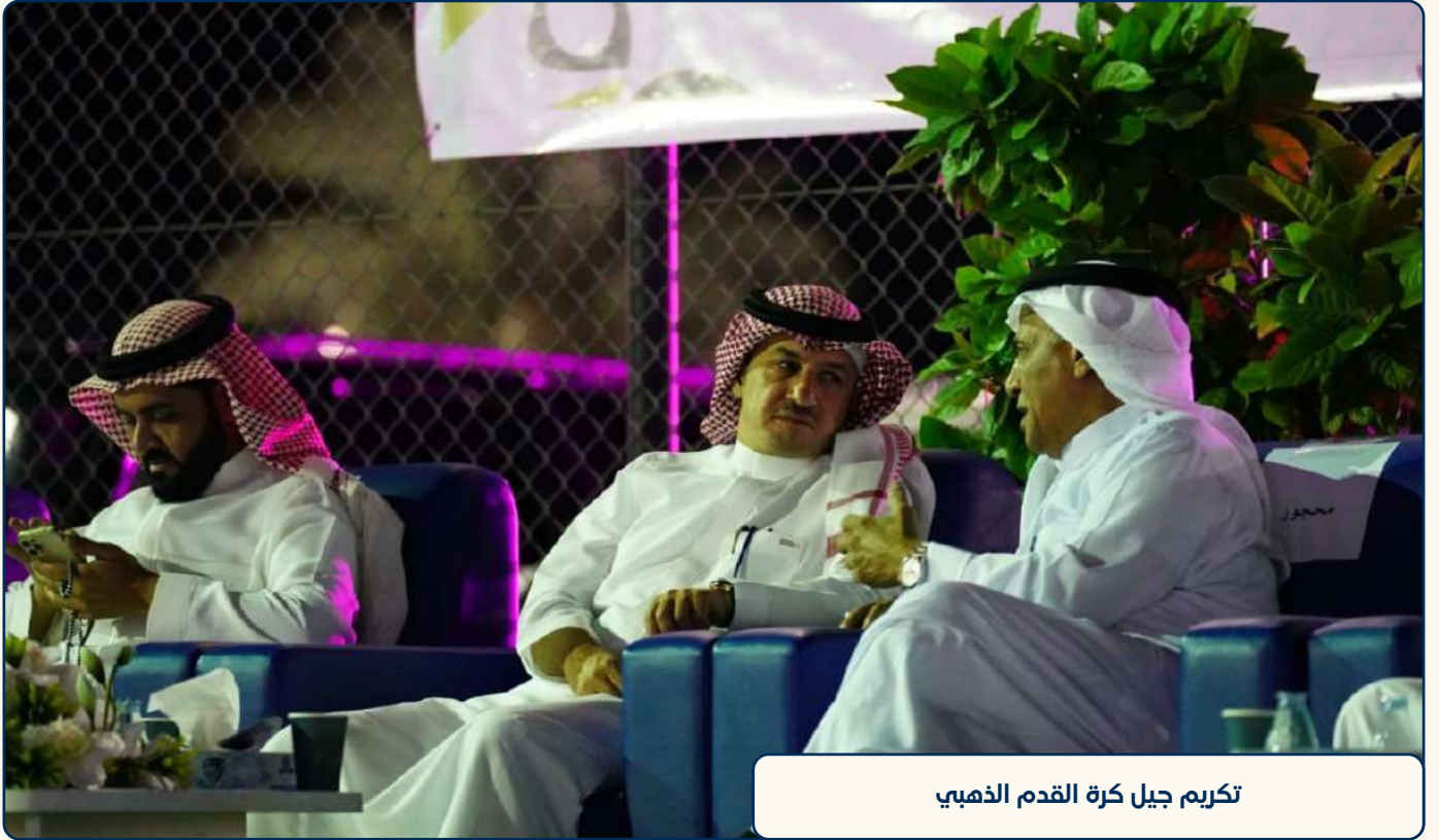
تكريم جيل كرة القدم الذهبي