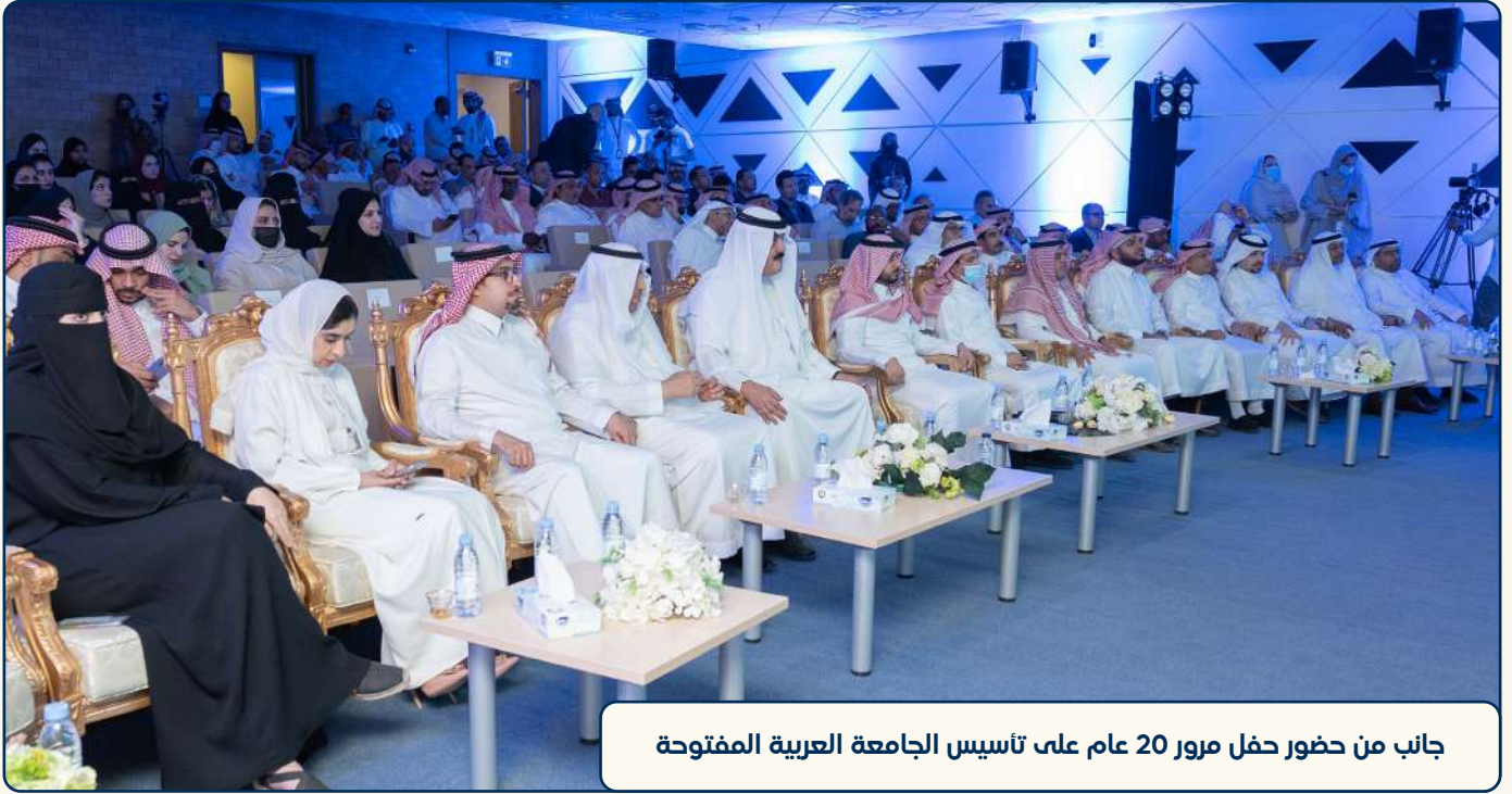
جانب من حضور حفل مرور 20 عام على تأسيس الجامعة العربية المفتوحة