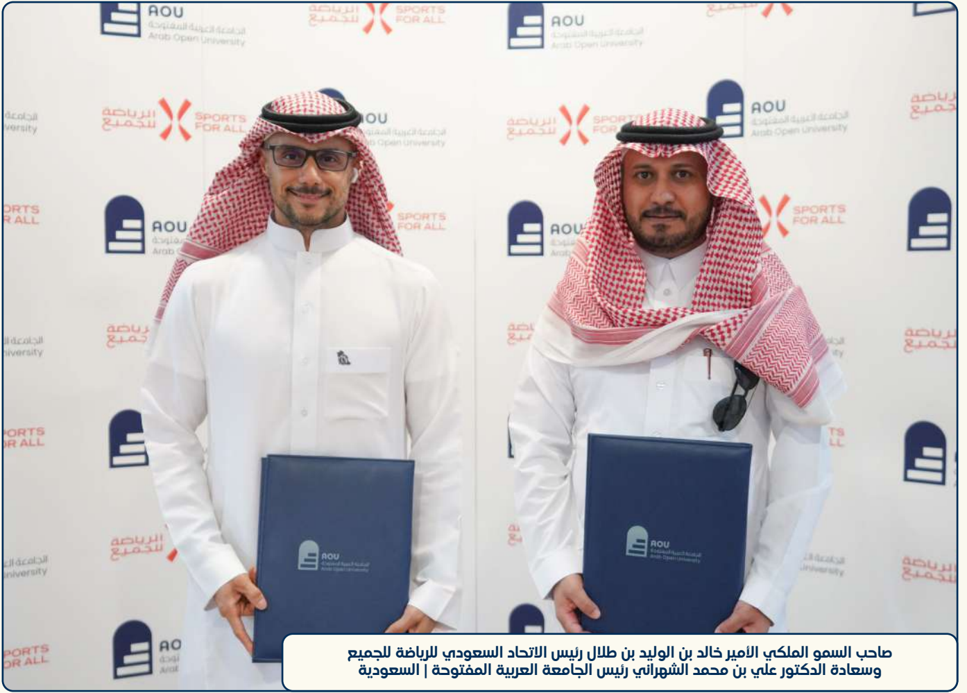
صاحب السمو الملكي الأمير خالد بن الوليد بن طلال رئيس الاتحاد السعودي للرياضة للجميع وسعادة الدكتور علي بن محمد الشهراني رئيس الجامعة العربية المفتوحة | السعودية