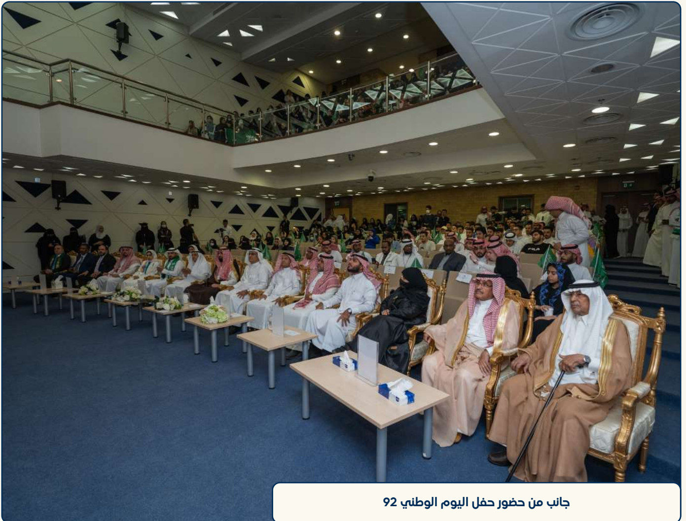
جانب من حضور حفل اليوم الوطني 92