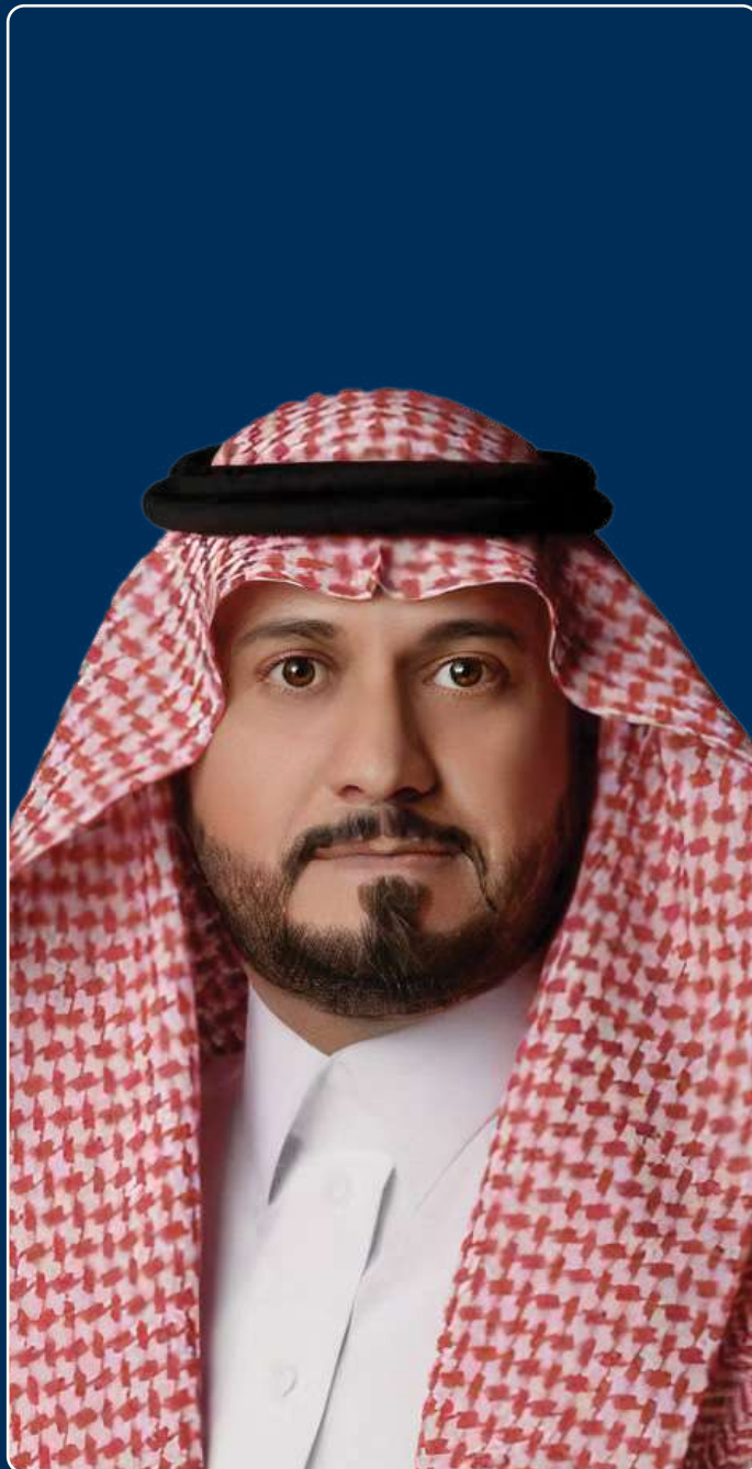
رئيس الجامعة العربية المفتوحة | السعودية د. علي الشهراني