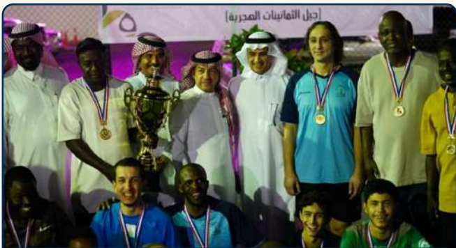
جانب من حضور حفل تكريم جيل كرة القدم الذهبي