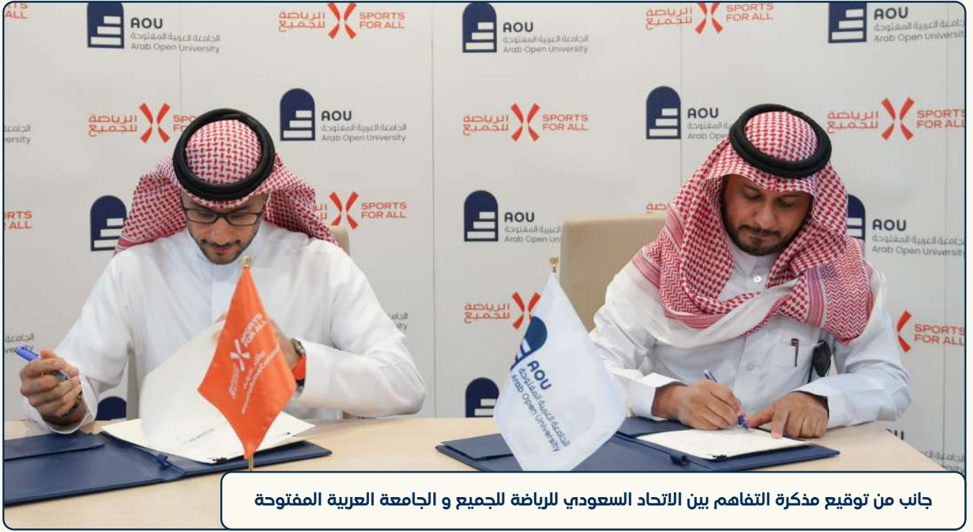
جانب من توقيع مذكرة التفاهم بين الاتحاد السعودي للرياضة للجميع و الجامعة العربية المفتوحة