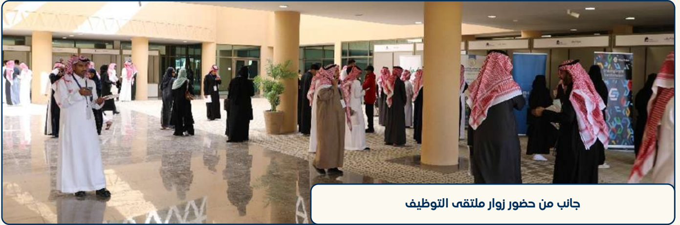
جانب من حضور زوار ملتقى التوظيف

وأوضح قائلاً: "حرصنا في الجامعة العربية المفتوحة على تنظيم هذا الملتقى في إطار تعزيز دور الجامعة الرائد من خلال الإسهام ببناء وتطوير هذا المجتمع وتنميته، وانطلاقاً من سعيها الدائم على تحقيق أحد مستهدفات رؤية المملكة 2030؛ والتي تتضمن الإسهام في توظيف المهن المتواجدة في سوق العمل، والاستثمار بدعم توظيف أبنائنا الشباب وبناتنا الشابات السعوديين لتهيئة فرص العمل لهم".