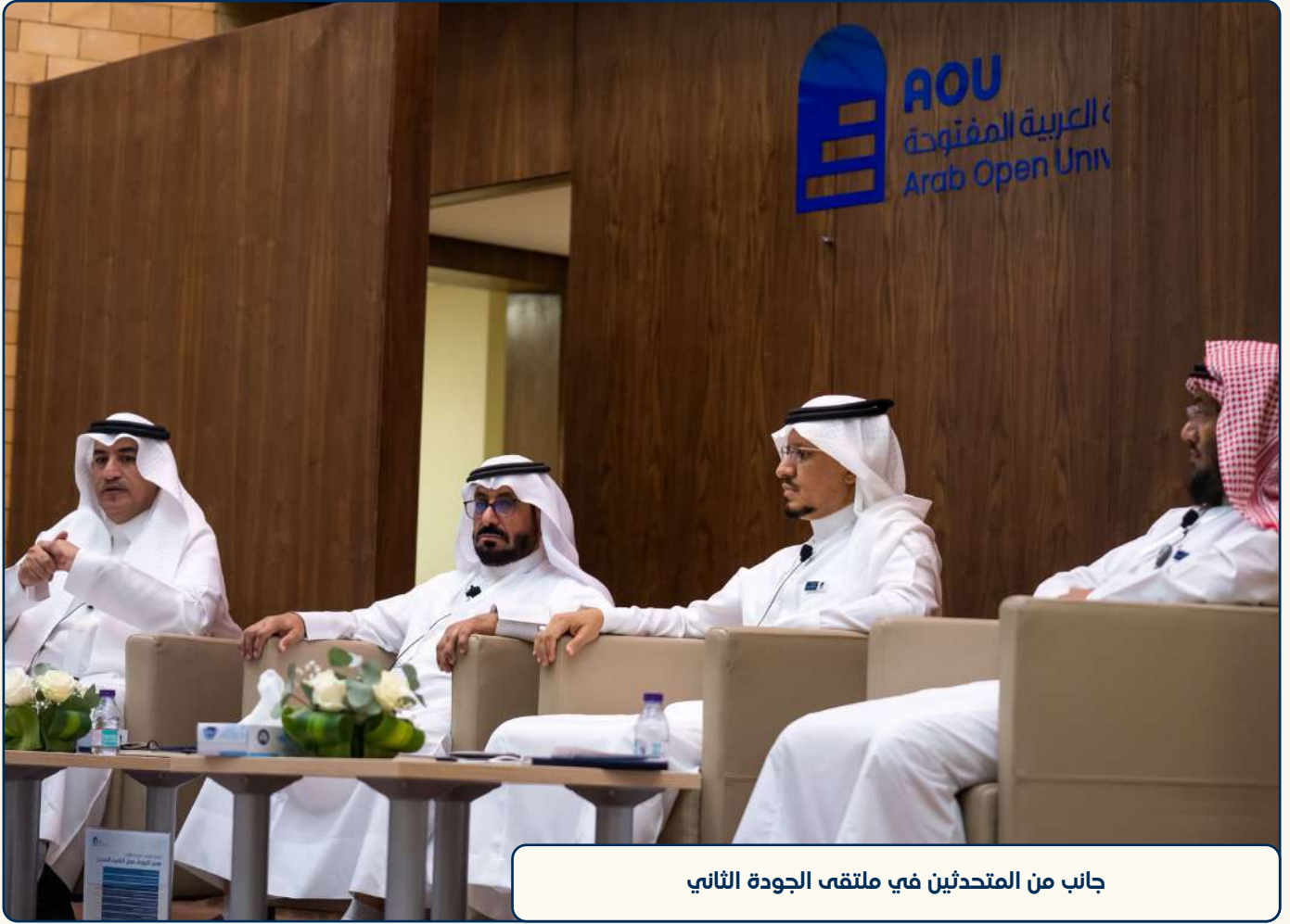
جانب من المتحدثين في ملتقى الجودة الثاني