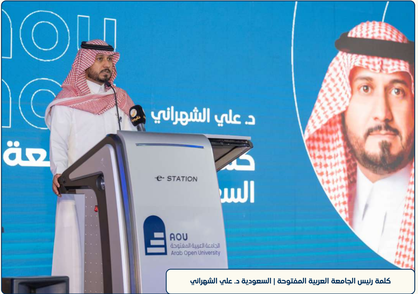
كلمة رئيس الجامعة العربية المفتوحة | السعودية د. علي الشهراني