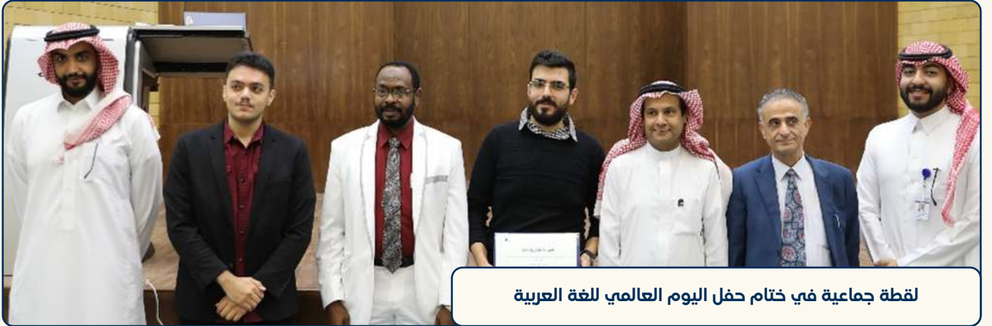
لقطة جماعية في ختام حفل اليوم العالمي للغة العربية

وأضاف: " اللغة العربية جزء أساسي من هويتنا وهوية وطننا، ولقد اختارها الله عز وجل لتكون لغة القرآن الكريم، وتعدّ اللغة الأكثر اكتمالاً بين اللغات الأخرى لما تنفرد به من مصطلحات فصحة وبلغّة تسهم في إيصال الأفكار والاحتياجات والمشاعر بطريقة متكاملة."