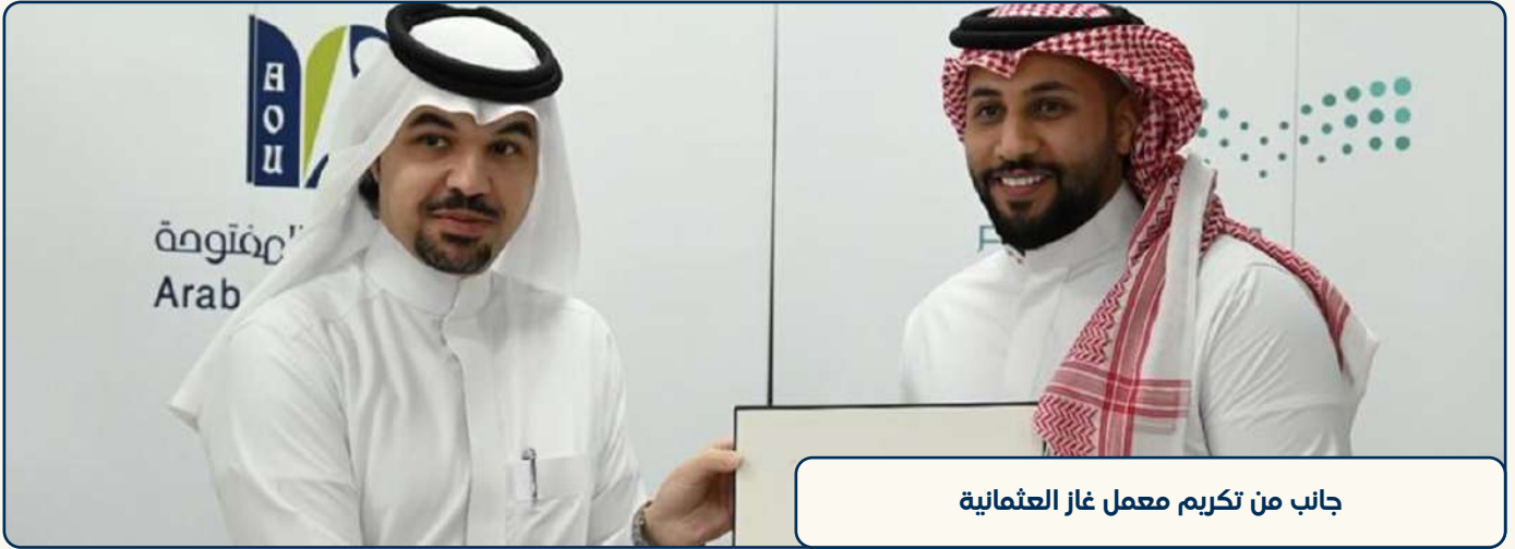
جانب من تكريم معمل غاز العثمانية