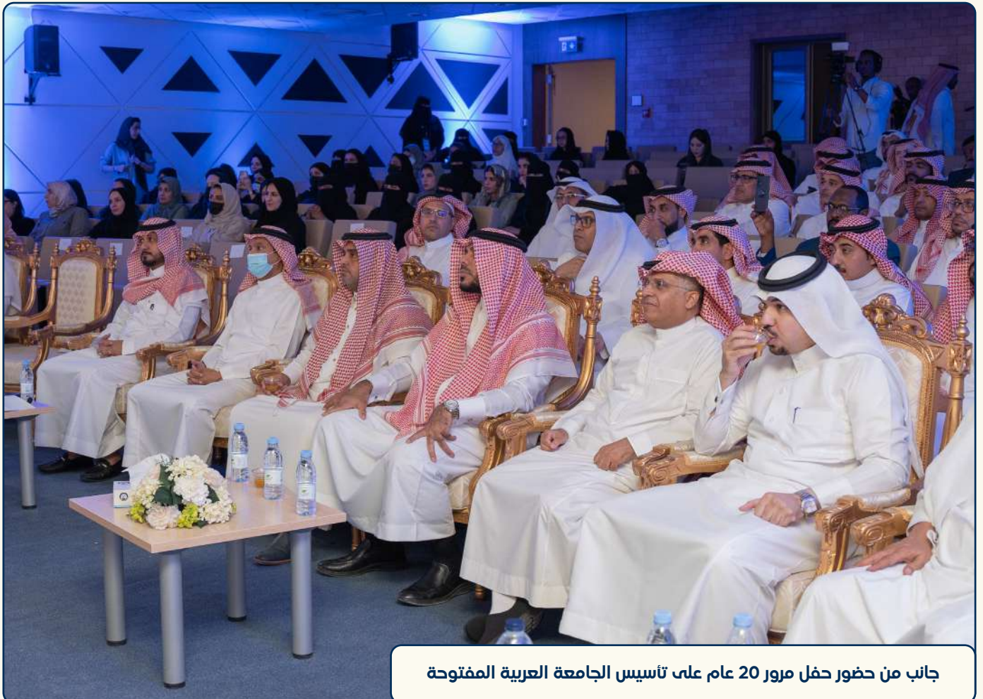
جانب من حضور حفل مرور 20 عام على تأسيس الجامعة العربية المفتوحة