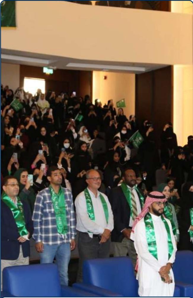
جانب من حضور حفل اليوم الوطني 92