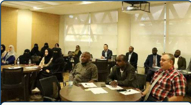
جانب من حضور منسوبي الجامعة العربية المفتوحة